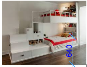
двухэтажная детская мебельная композиция, на фото пример